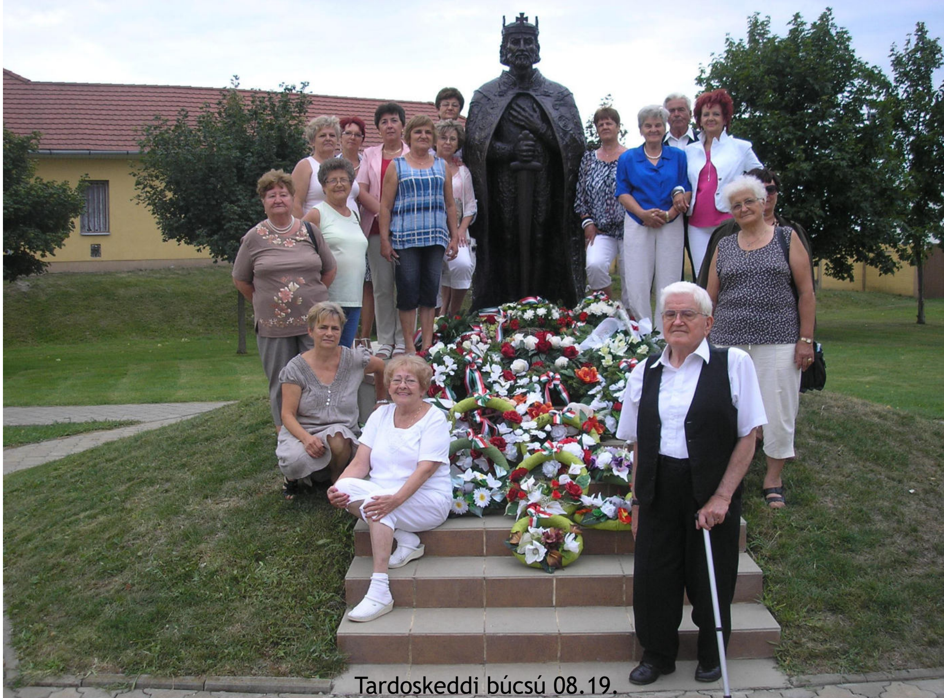
Tardoskeddi búcsú 08.19.